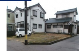
新潟県燕市(土地) 譲渡額約350万円