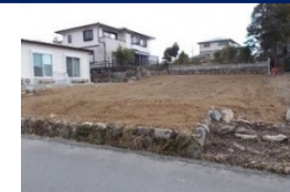
三重県津市(土地) 譲渡額約270万円