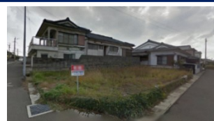
鹿児島県いちき串木野市(土地) 譲渡額約350万円